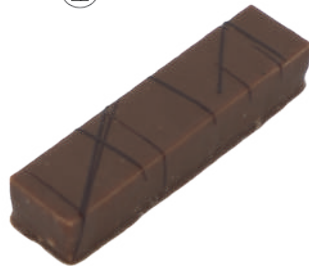
Cacahuète Praliné cacahuète