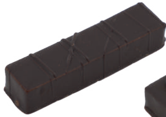
Angoulême Ganache cognac