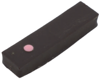
Bouton Ganache floral