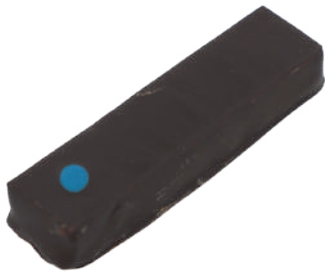
Cascade Ganache cassis