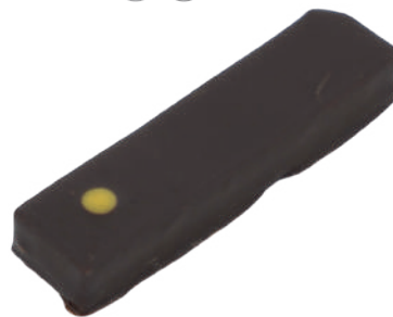
Cédrat Ganache citron