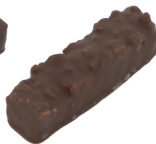
Croc noisette Praliné noisette