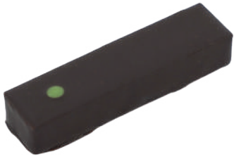
After Ganache menthe