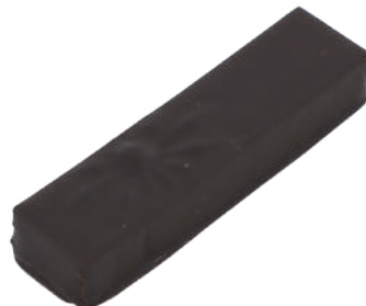
Cassonade Ganache spéculoos