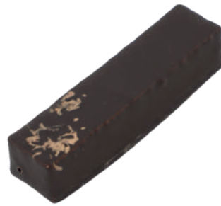
Calin Praliné noisette, caramel mou