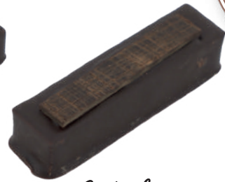
Ardéchois Ganache marron