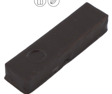
Ceylan Ganache thé