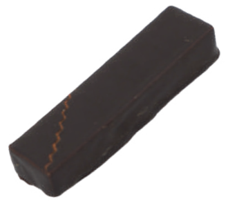
Caprice Praliné fruits secs et orange