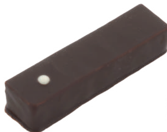
Coeur feuilleté Praliné feuilleté