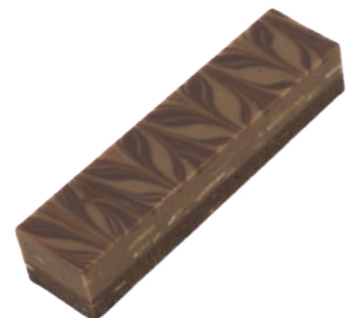
Duo Gianduja lait et noir