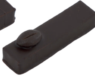
Arabica Ganache café